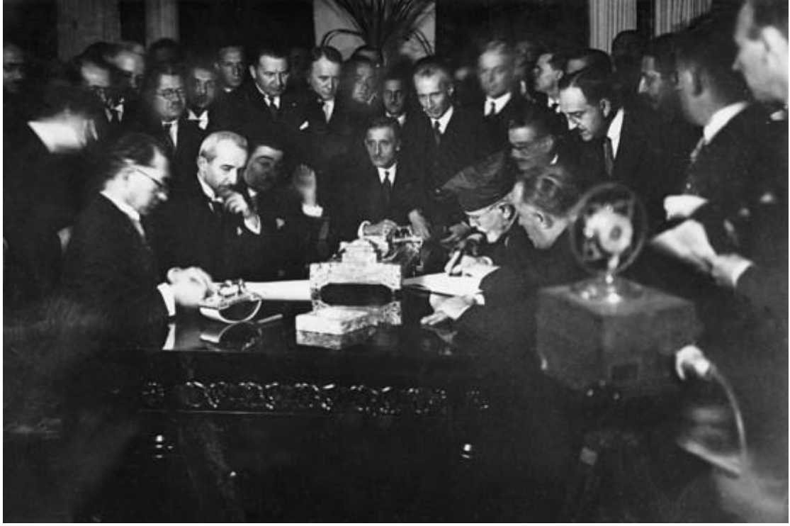
( اثناء الابع على معاهدة سفد )